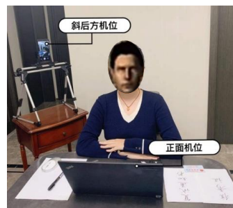
图 1 考生双机位示意图

5) 考生需将腾讯会议用户的头像更改为本人近期免冠头部照片。面试采用双机位，环境机位要求能在侧后方监控考生和主机位屏幕。应急通信手机应出现在环境机位图像中并远离考生本人。